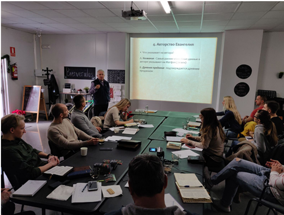
Занятия в группе в Испании

Господь обильно благословил нас и в этом уходящем году. Милость Его велика! С Рождеством Христовым!