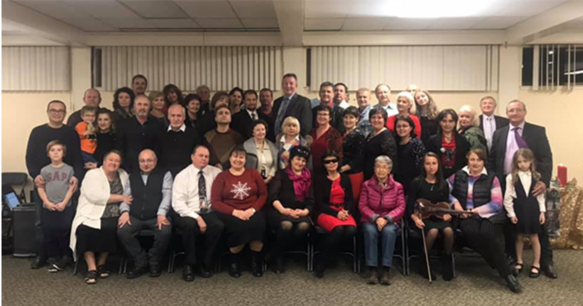
Гости и хозяева