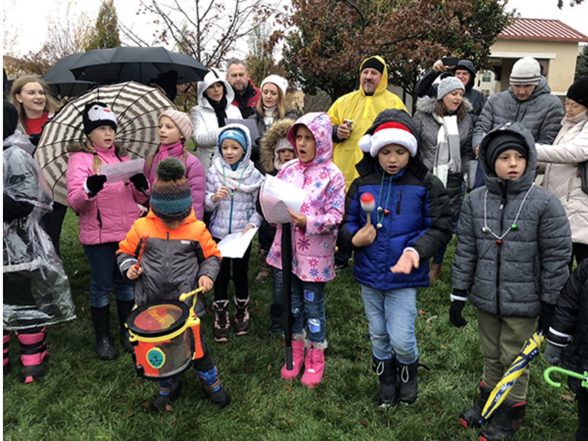
Дети, участвующие в евангелизации