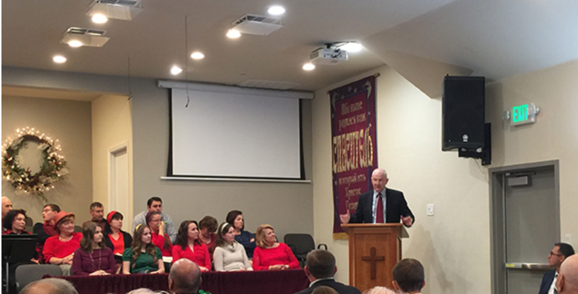
В церкви Hayward