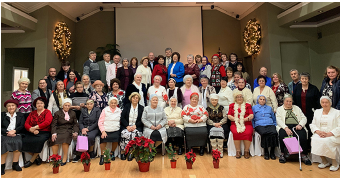
Празднование десятилетнего юбилея группы вдов и одиноких Второй славянской церкви

В преддверии Рождества, в нескольких церквях были организованы праздничные встречи для вдов и одиноких. О том где и как они проходили, читайте в заметке, помещенной на вебсайте Объединения – кликните здесь .