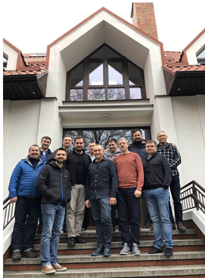
Хорошо братьям вместе!