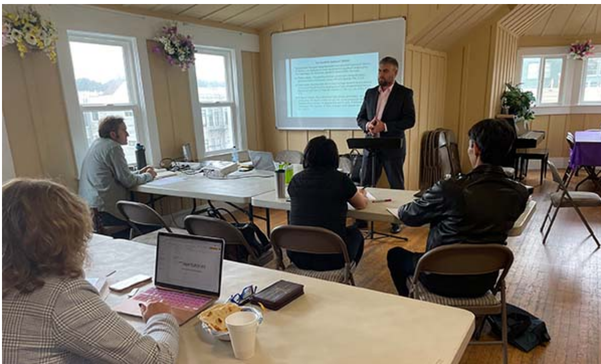
Урок в церкви Сан-Франциско