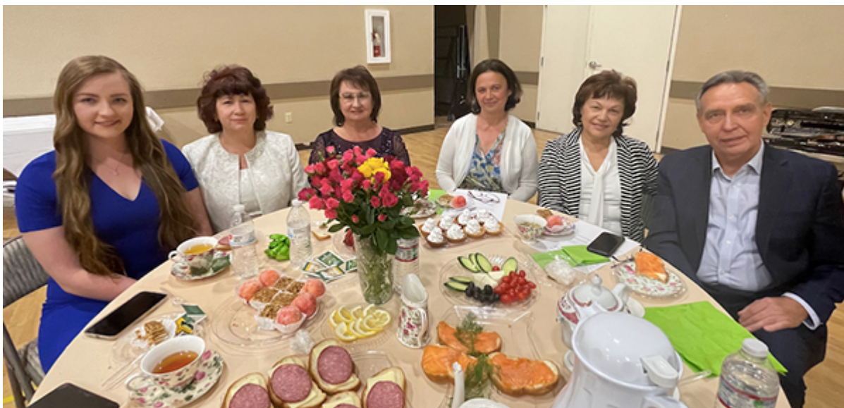
Гости и организаторы встречи