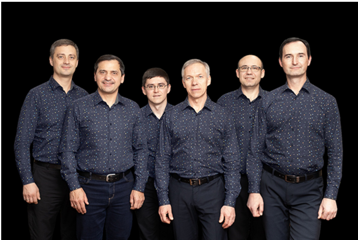
Сегодняшний состав группы «Ковчег»