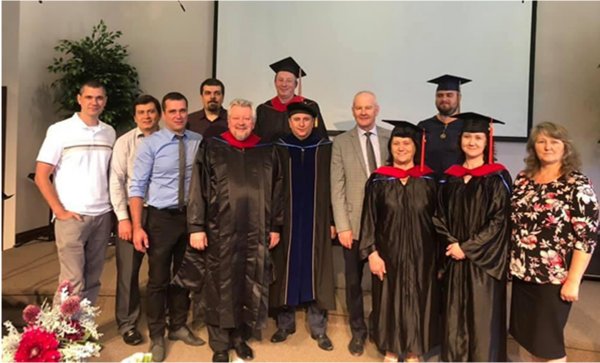
Только что номинированные магистры, преподаватели и другие студенты

отдела читайте в заметке А. Пронина, опубликованной на вебсайте Объединения.