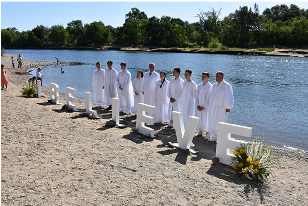
Крещение на реке