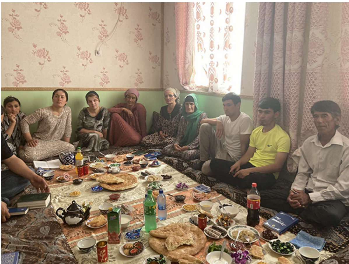
Одно из общений с таджикскими верующими