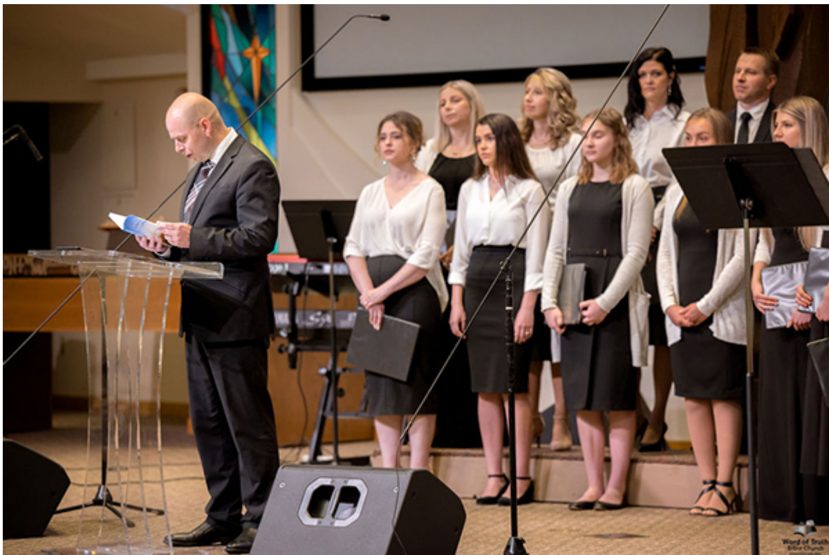
Во время юбилейного служения в церкви