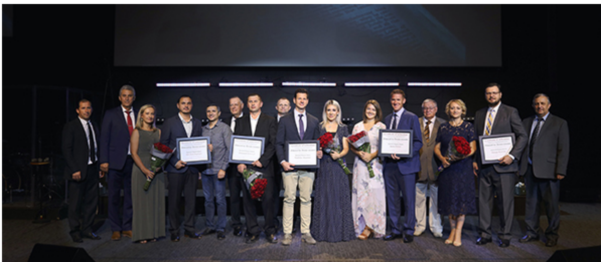
Команда служителей церкви пополнилась пятью новыми дьяконами