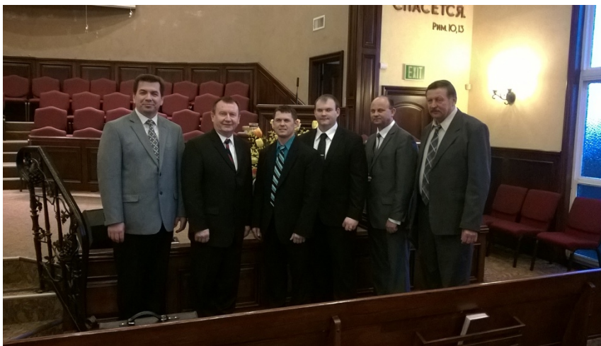
Рукополагающие и рукоположенные

Более подробно - читайте на вебсайте Объединения . Там же дано больше фотографии, сделанных во время рукоположения.