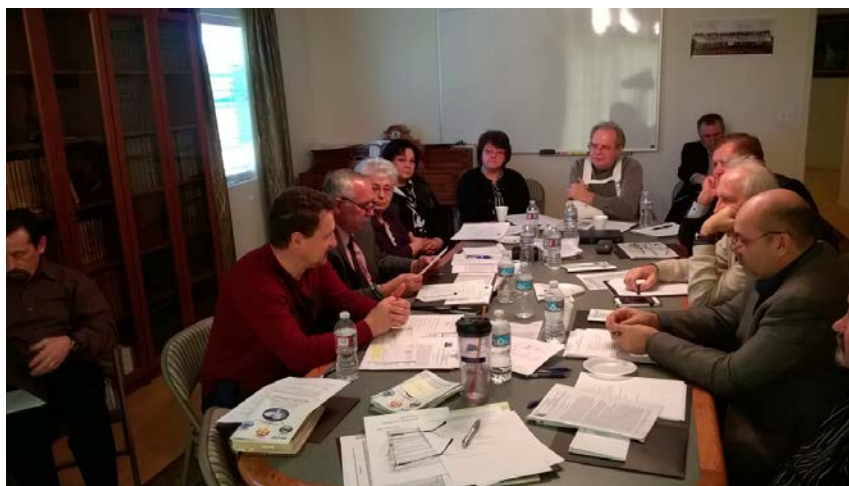
Во время встречи руководителей отделов