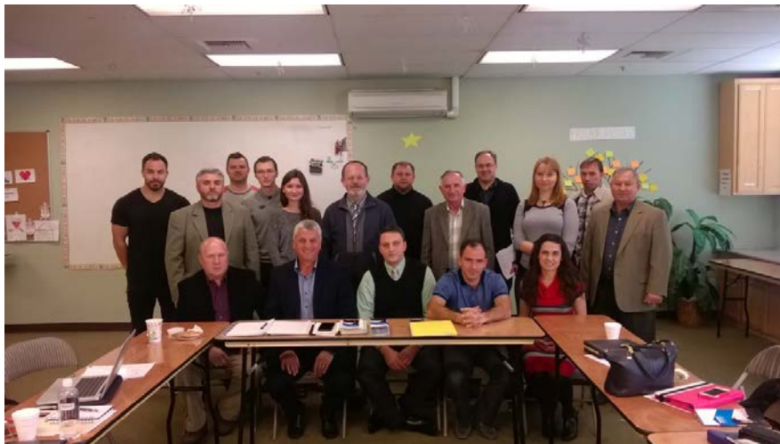
Совместная встреча сотрудников отдела и представителей миссионерских отделов церквей

Значительная часть времени была посвящена обсуждению путей помощи миссионерского отдела Объединения поместным церквям, вопросам местного благовестия, подготовке миссионеров и служения в Европе для славянских иммигрантов.