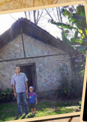
Вот так выглядит «Дом молитвы» в Папуа-Новой Гвинее.