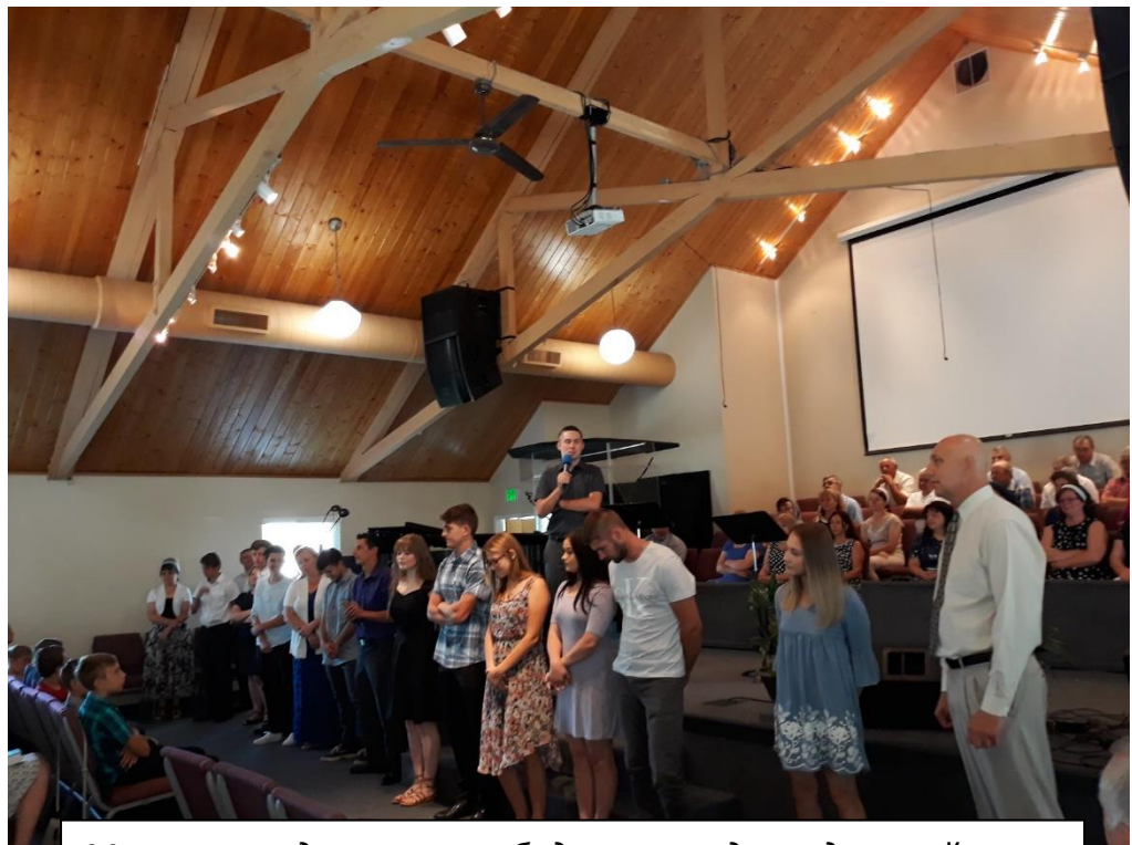
Молитва над теми, кто будет проводить детский лагерь на следующей неделе.

На следующий день, в воскресенье, 8-го июля , мы посетили богослужение в нашей церкви Дом Евангелия . Было очень приятно встретить старых друзей, с которыми много лет вместе служили Господу. К сожалению, далеко не всех довелось встретить – около 10 из тех, кого мы оставили, уезжая в 2016-м году, отошли к Господу за это время. Я участвовал в богослужении проповедью Слова Божия.