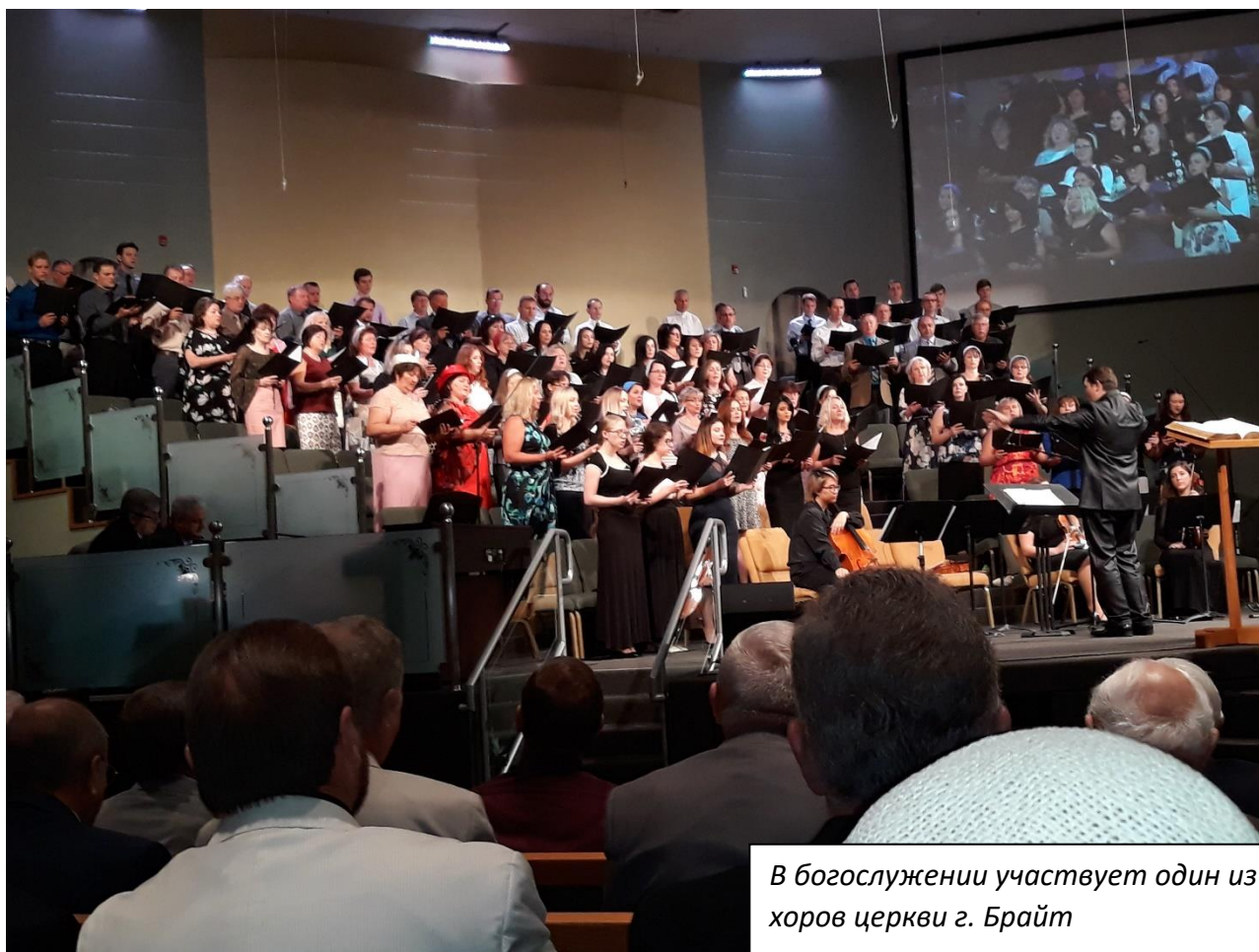
В богослужении участвует один из хоров церкви г. Брайт