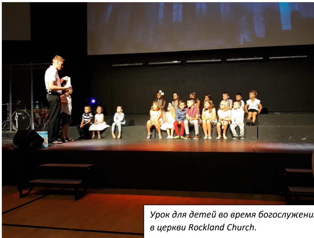
Урок для детей во время богослужения в церкви Rockland Church.