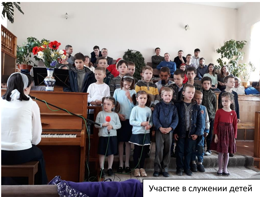
Участие в служении детей

Служение в церкви, которую мы посетили, было торжественным. Очень красиво пел хор. Хотя община небольшая – около 60 членов, певческое служение в ней поставлено на высоком уровне. В служении участвовали не только молодежь и дети, но и люди в преклонных годах. Одна из них, женщина старше 80 лет рассказала наизусть длинное стихотворение на тему праздника. Рассказывала она очень красиво, с выражением.