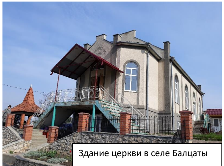
Здание церкви в селе Балцаты

В воскресенье, 21-го апреля , мы посетили церковь в селе Балцаты, которое расположено неподалеку от Кишинева. Учитывая, что в Молдове, как и в Украине и России, праздник Пасхи отмечался в этом году на одну неделю позже, чем в Америке и Западной Европе, в Молдове праздник торжественного въезда Иисуса Христа в Иерусалим праздновался 21-го апреля. Таким образом, для нас в этом году была возможность дважды праздновать этот праздник – один раз в Латвии, другой раз в