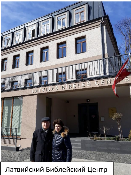
Латвийский Библейский Центр