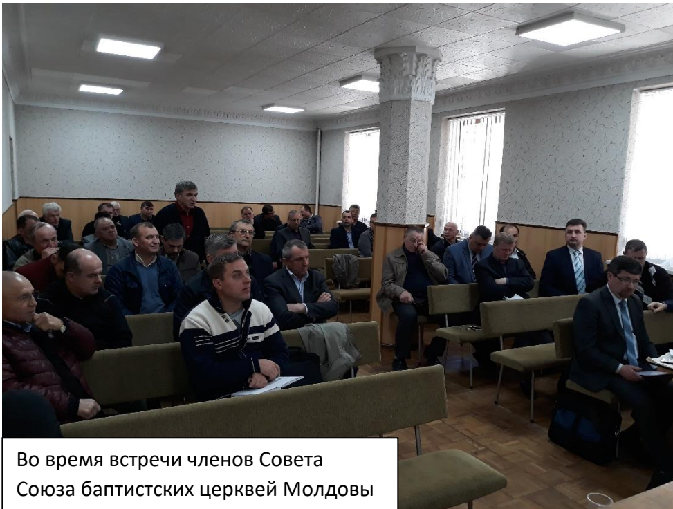
Во время встречи членов Совета Союза баптистских церквей Молдовы

Ниже информация о некоторых событиях в нашем служении в течение апреля месяца.