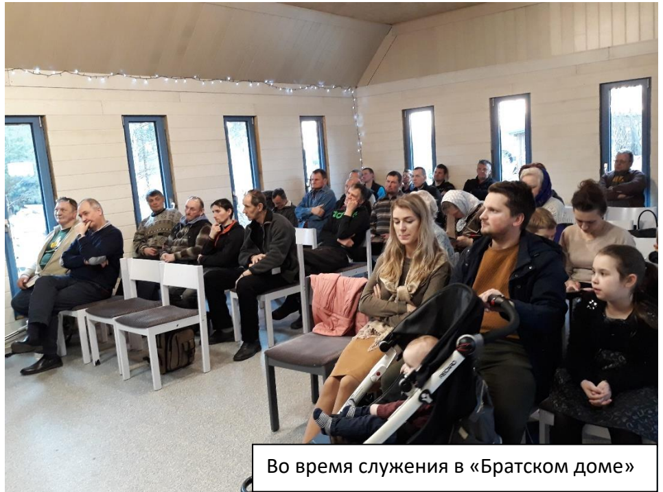
Во время служения в «Братском доме»