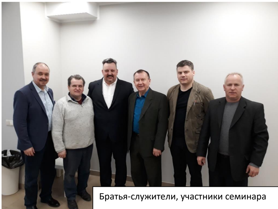
Братья-служители, участники семинара