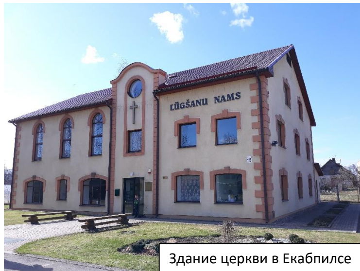
Здание церкви в Екабпилсе

В воскресенье, 14-го апреля , мы посетили церковь в г. Екабпилс, который находится в 120 км от Риги. В этот день в церквях Латвии вспоминали торжественный въезд Иисуса Христа в Иерусалим. Нам было приятно разделить общение с членами этой церкви в этот праздник. Я принял участие в служении проповедью Слова Божия.