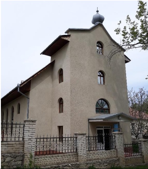
Здание церкви Вефиль в г. Теленешты

молитвы в Гефсиманском саду в четверг ночью до Его воскресения в первый день недели. Постановка была очень хорошо подготовлена и исполнена. Явно было, что в этой небольшой церкви – около 60 членов, есть много талантливых людей. В заключение праздничного служения мне была предоставлена возможность сказать пасхальную проповедь.