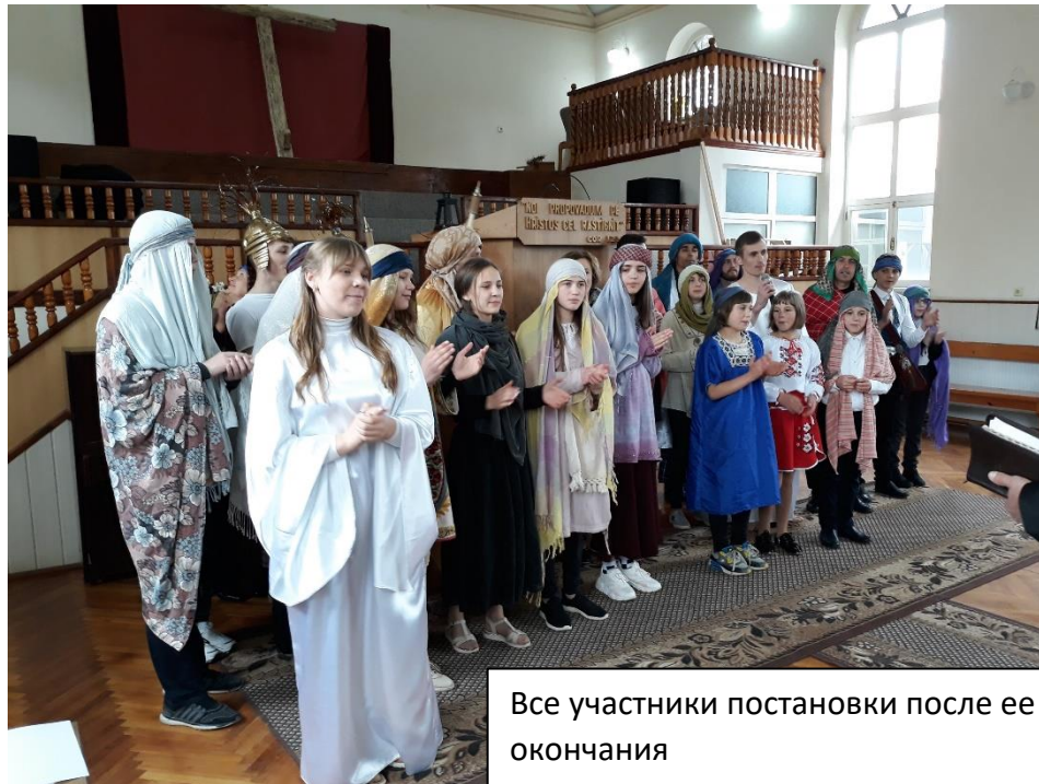
Все участники постановки после ее окончания

Для студентов и преподавателей университета конец апреля месяца знаменует собой начало завершающего периода в весеннем семестре. После текущей недели пасхальных каникул пройдет еще пару недель занятий. После этого будут экзамены, и семестр в конце мая закончится. Время пролетело быстро. Грустно сознавать, что через короткое время мы расстанемся с теми студентами, которые заканчивают учебу в этом году. Однако в этом и смысл нашего служения в университете – дать студентам необходимые знания и навыки для труда и служения и отпустить их в самостоятельную жизнь.