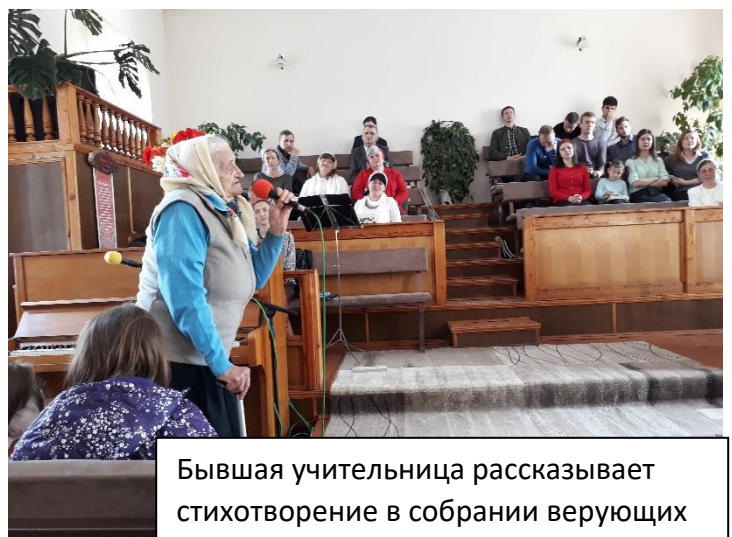
Бывшая учительница рассказывает стихотворение в собрании верующих

Мне была предоставлена возможность в этом служении сказать основную проповедь.