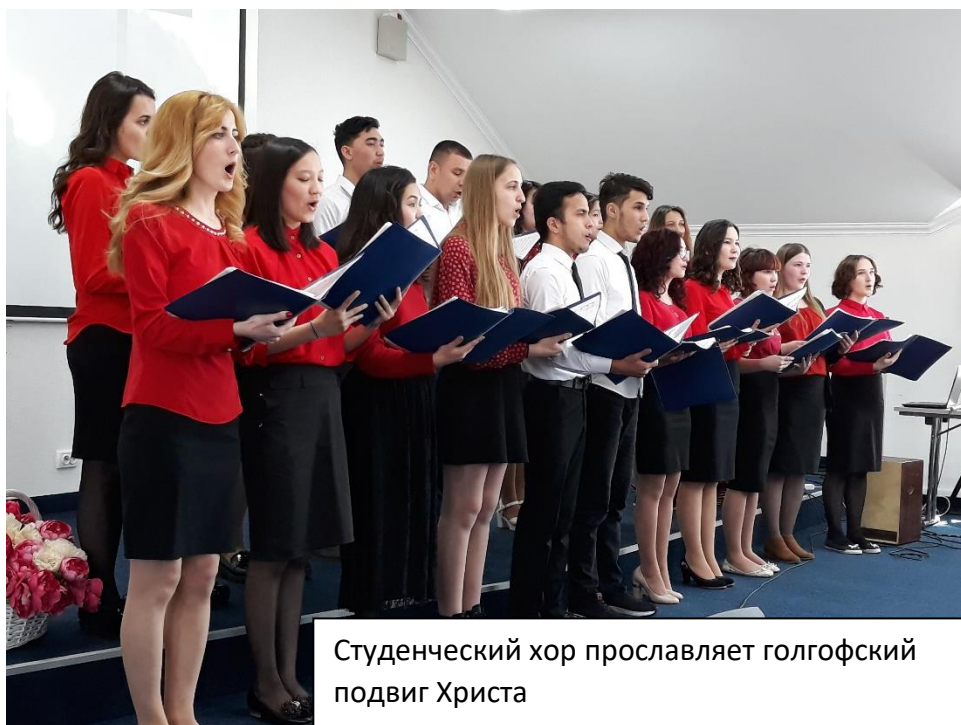
Студенческий хор прославляет голгофский подвиг Христа

25-го апреля , в четверг, в 12:00 дня, в нашем университете состоялось праздничное служение, посвященное празднику Пасхи. Очень красиво пел студенческий хор, состоящий из представителей разных стран – Казахстана, Узбекистана, Таджикистана и др. Приятно было видеть такой «интернациональный» коллектив, прославляющий голгофский подвиг Христа, который сделал возможным такое единство людей разных национальностей.