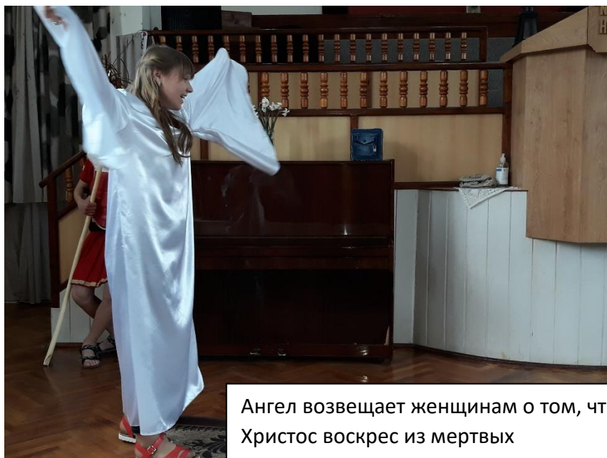
Ангел возвещает женщинам о том, что Христос воскрес из мертвых