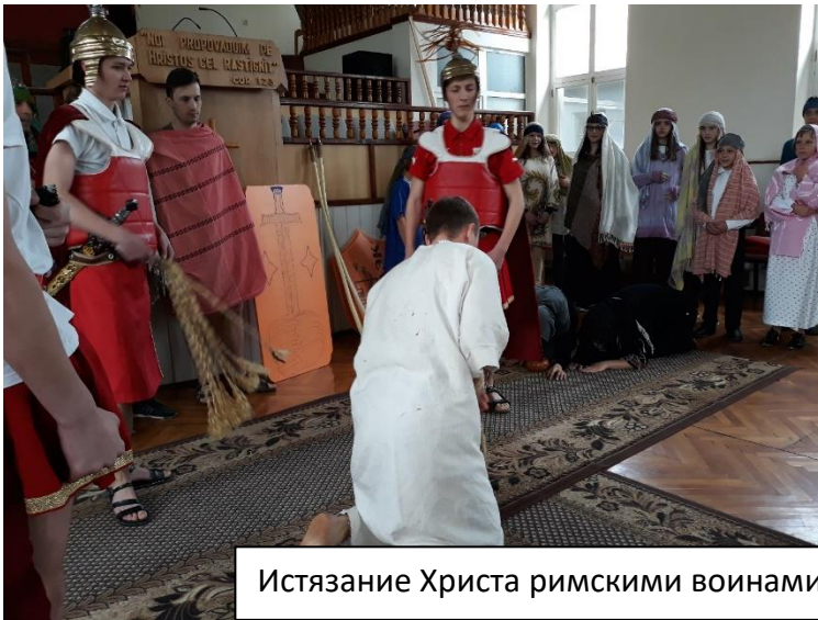
Истязание Христа римскими войнами