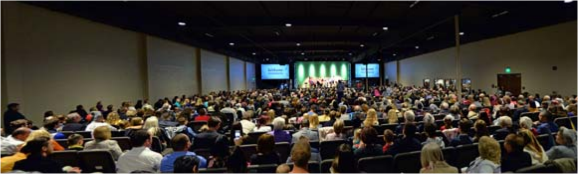
Зал нового молитвенного дома