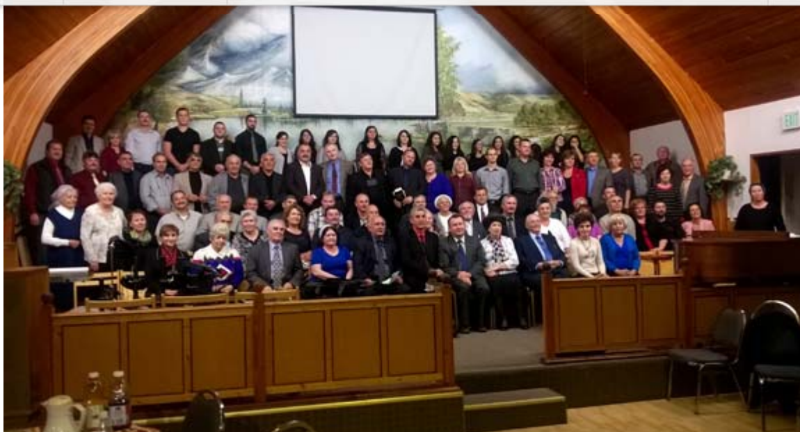
Участники служения и гости