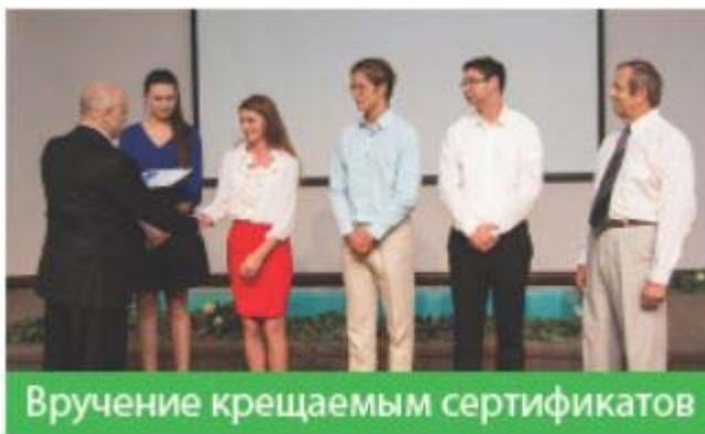
Вручение крещаемым сертификатов

2 августа 2015 года в Евангельской христианской церкви Монтебелло, Калифорния, четыре молодых человека заключили завет с Господом. «Радость переполняла наши сердца: новые души присоединились к поместной общине, вступили на стезю борьбы с силами тьмы. Прилежно