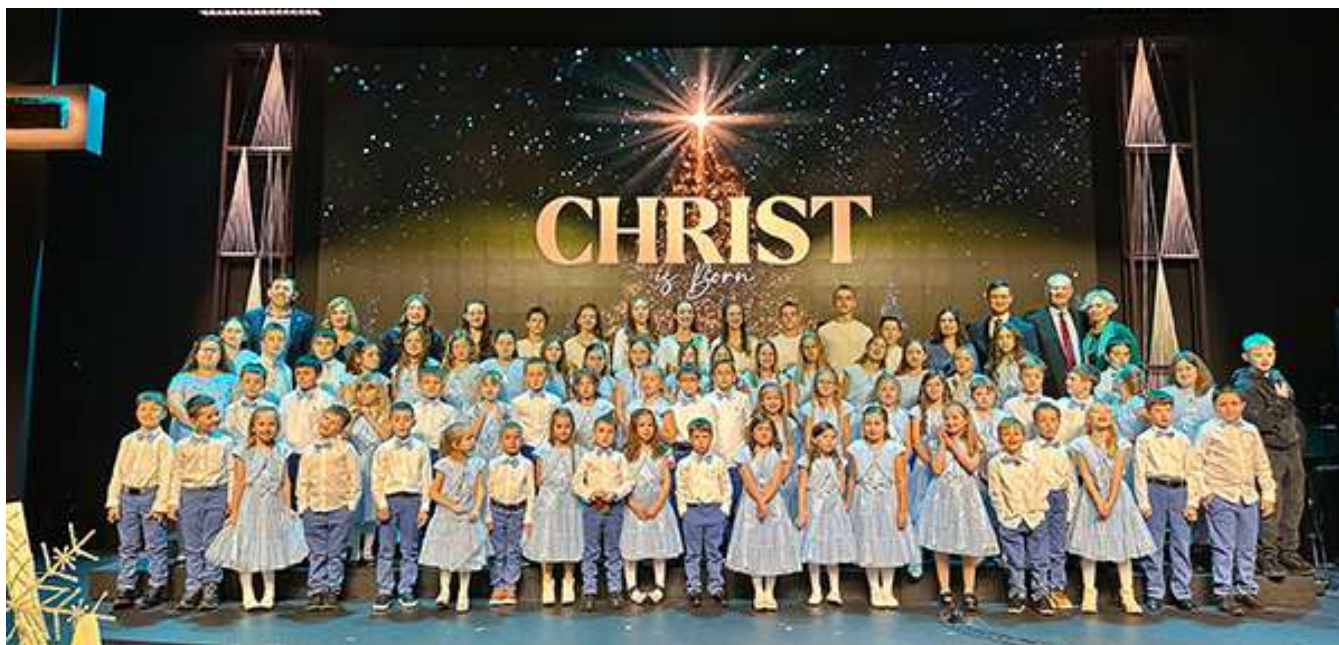
Детский хор стал украшением служения