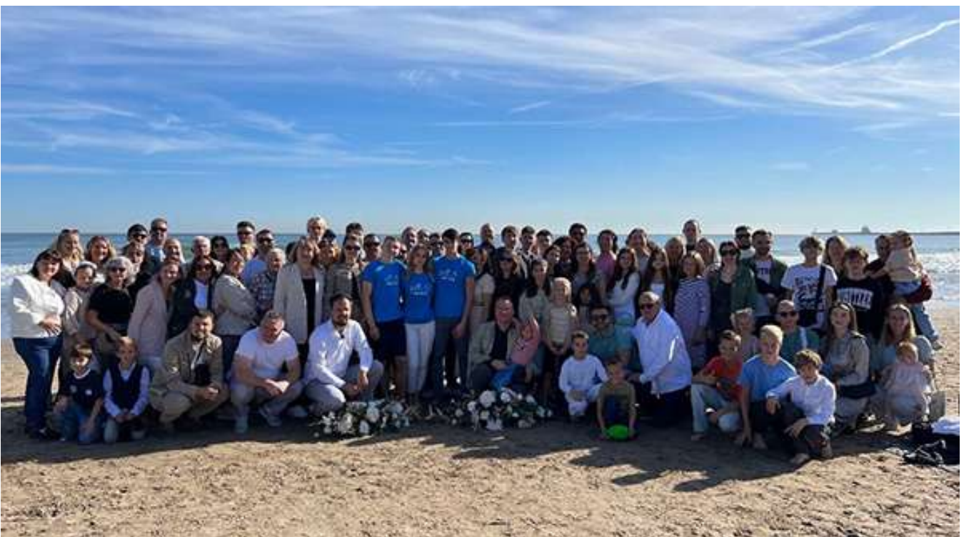
Крещение – трое молодых людей присоединились к церкви