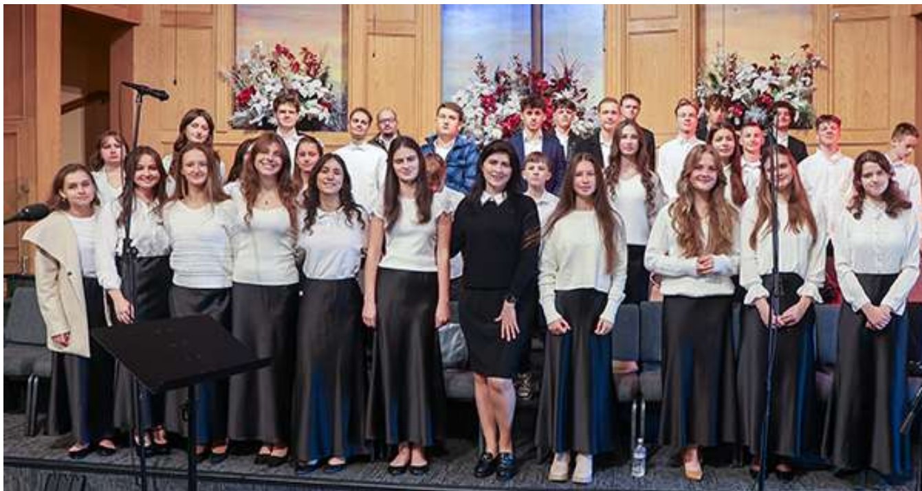
Молодежный хор церкви Grace Avenue Bible Church