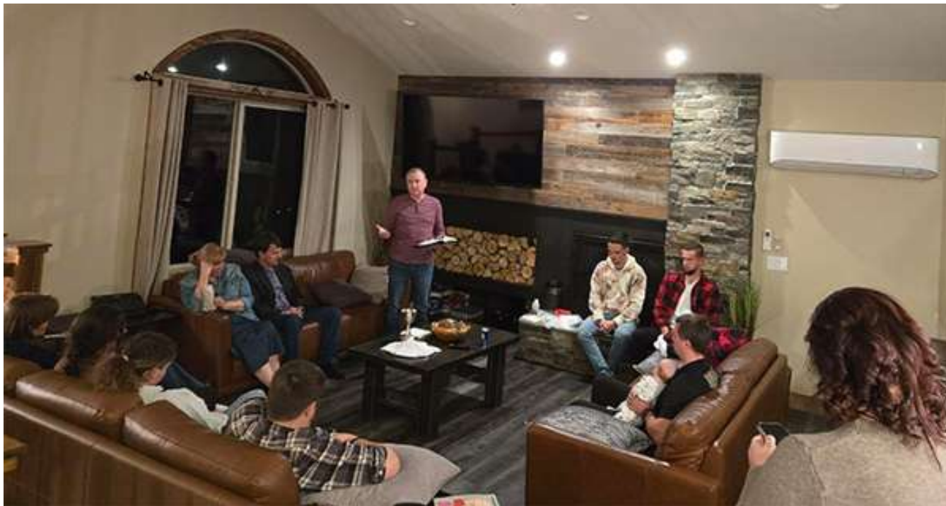
Во время ретрита