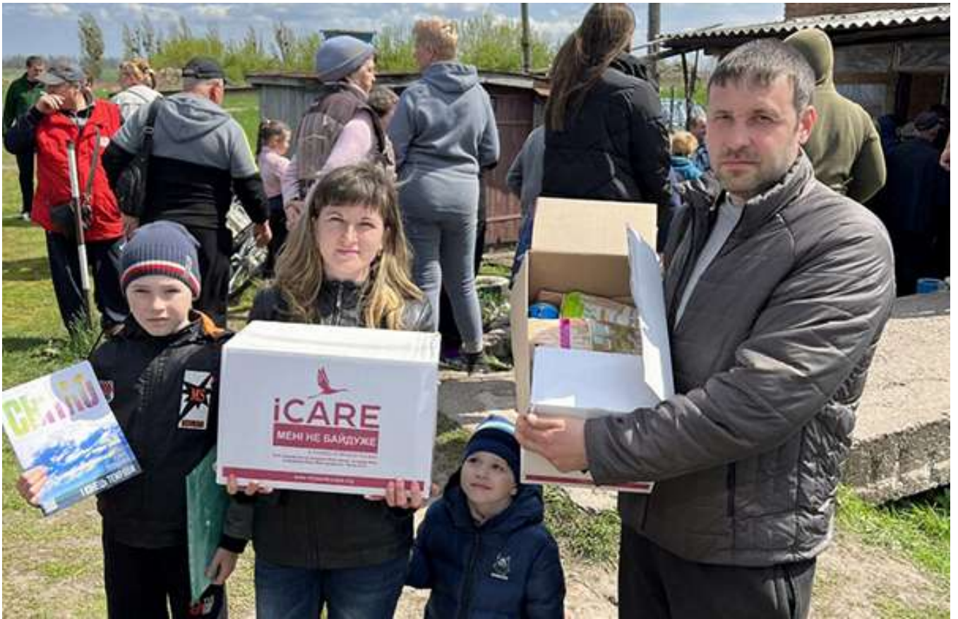
Во время одной из акций в Украине