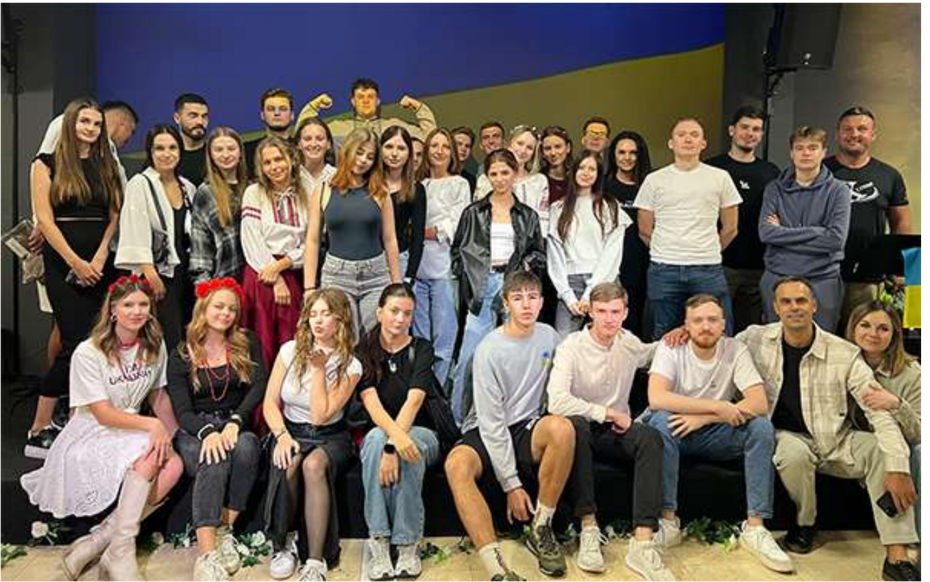
Участники евангелизационного вечера для молодёжи «Украинские вечерницы»