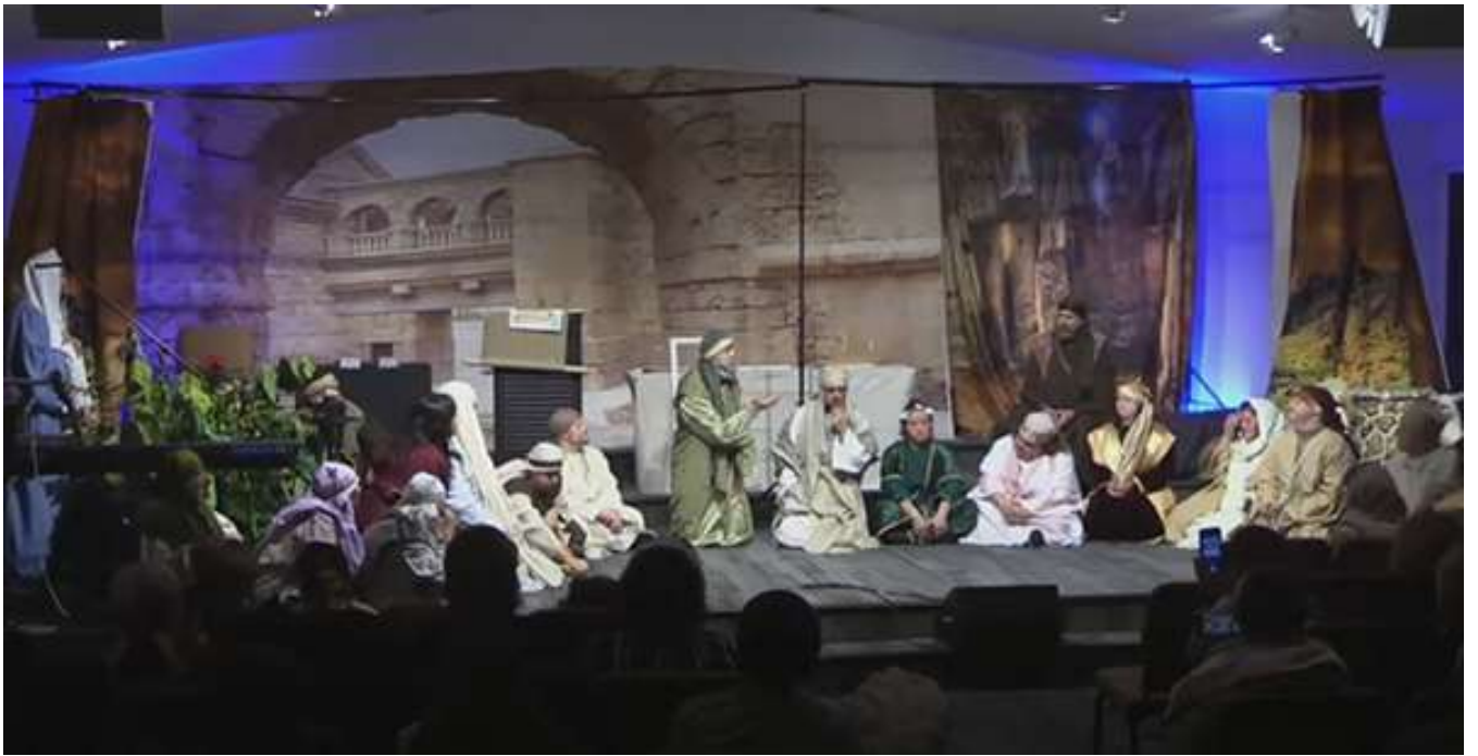
Сцена из постановки