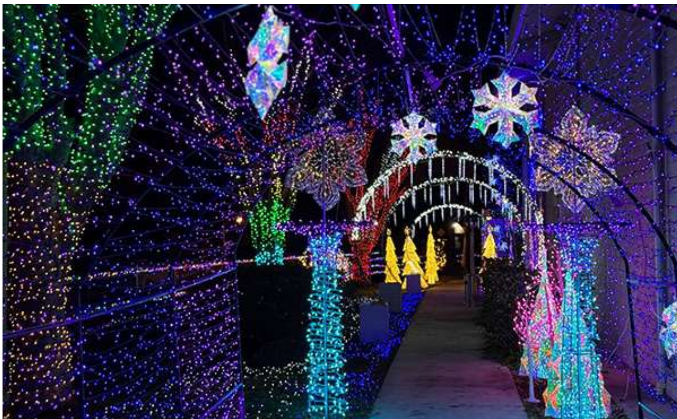
Рождественские огни – красиво, как в сказке!

которого прошёл 13 и 14 декабря на территории церкви. Десятки местных жителей смогли посетить праздничное мероприятие, ощутить радость приближающегося праздника и узнать о Царстве, созданном благодаря рождению, жизни, смерти и воскресению Иисуса Христа. Подробнее в статье Я. Захарнев.