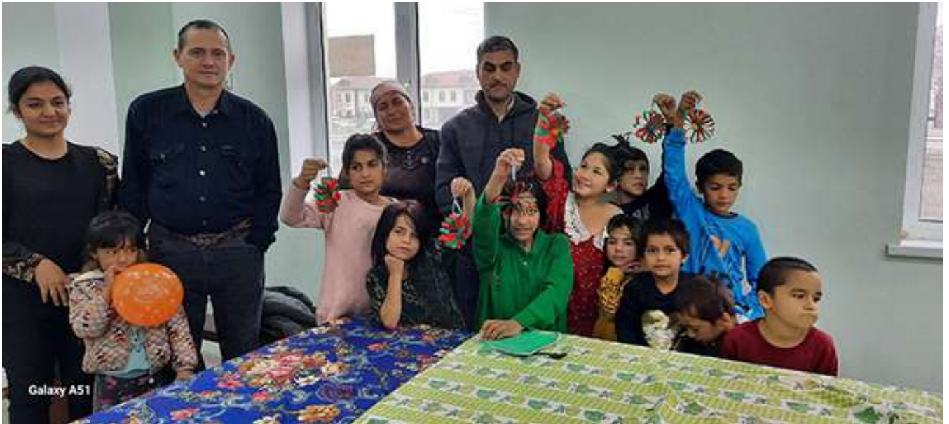
Часть цыганских детей после урока, когда они впервые в жизни делали игрушки на Рождество. Взрослые слева направо: переводчица, пастор поместной церкви, и цыгане – муж с женой

В августе этого года миссионерский отдел Объединения и Grace Family Church провели два детских лагеря в Узбекистане – в Бухаре и Сырдарье. Читая рассказ о том, как они прошли , не один человек задавался вопросом: «А что дальше? Будет ли продолжение начатого?» А дальше Бог явно показал, что и цыгане, и узбеки Ему не безразличны, и Он любит и заботится о них так же, как и о других народах. Читайте продолжение истории по этой ссылке .