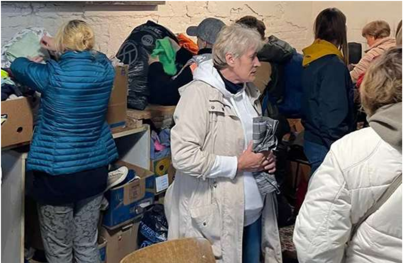
Раздача гуманитарной помощи во Львове, Украина