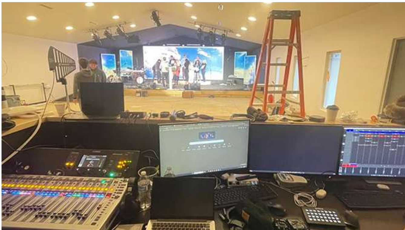
В процессе ремонта